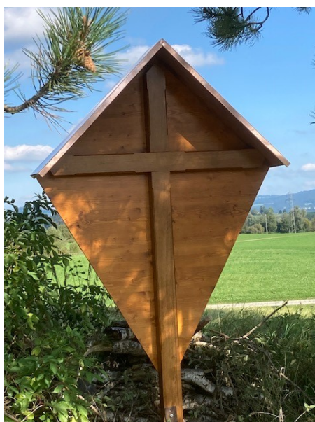
Wegkreuz im Buerli, Maiglückhügel