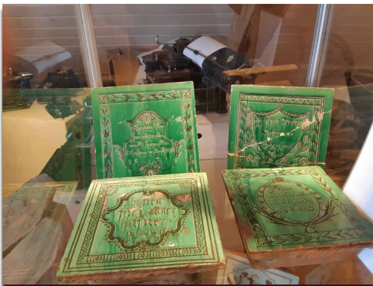
Notter Ofenkacheln im Museum

Im vergangenen Vereinsjahr konnten wir einige Führungen anbieten.