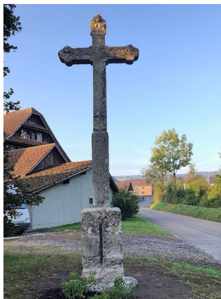
Wegkreuz bei der alten Kirche